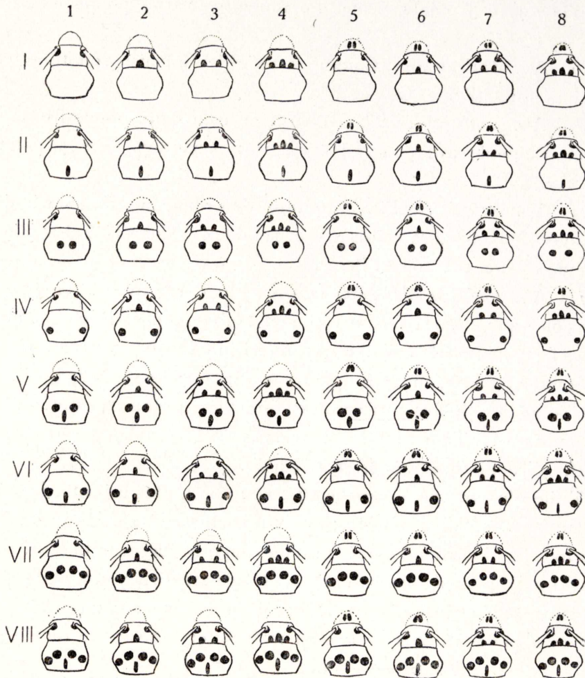
Fig. 3.—Schéma des aberrations probables (fondées sur la disposition diverse des callosités de la tête et du pronotum) de la Phyt. (Musaria) puncticollis Fald. ( M. puncticollis Fald. et M. persica Ganglb.).

d) Ab. trimaculata Pic. Tête rouge avec deux points sur le front,