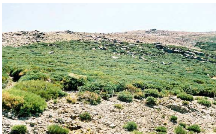
FIGURA 2. La vegetación y el paisaje de la Sierra de Candelario a partir de 1500 m de altitud están dominados por Cytisus oromediterraneus (escoba, retama o piorno serrano).