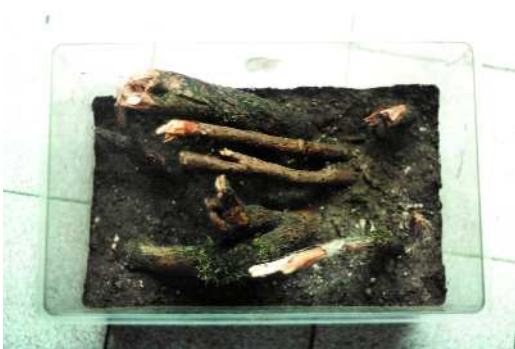
FIGURA 8. Terrario recreando el hábitat natural de Drymochares cylindraceus .