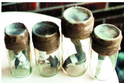
FIGURA 6. Recipientes conteniendo tallos con una sola larva.