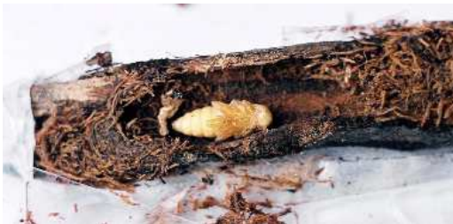
FIGURA 11. Pupa de Drymochares cylindraceus en sus primeros días, dentro de la cámara pupal.