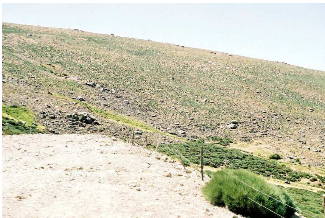
FIGURA 14. Zona de la Sierra de Candelario (Salamanca) sometida a quema para la obtención de pastos.

y taponándolo con pasta conglomerada elaborada por ella misma, y retrocede hasta la parte central, donde se acomoda para la ninfosis. Se ha observado una reducida mortalidad de las larvas, que siempre se producía en las primeras semanas tras su recolección (Tabla 2).