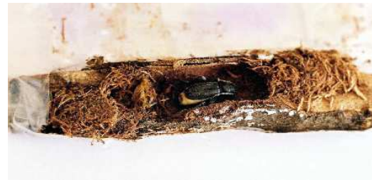
FIGURA 12. Adulto a los pocos días de completar la metamorfosis.

mes de ser fecundadas y los machos a los 15 o 20 días de haber copulado. Asimismo, y siempre en condiciones de cautividad, un macho podía copular con la misma hembra durante más de 10 días en las horas nocturnas.