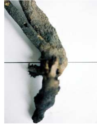
FIGURA 13. Orificio de salida del adulto en una rama de Cytisus . La línea recta representa la división «parte subterránea-parte aérea».