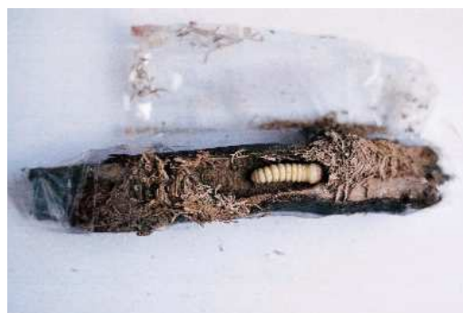
FIGURA 7. Larva de Drymochares cylindraceus en su galería ya acondicionada como cámara pupal.