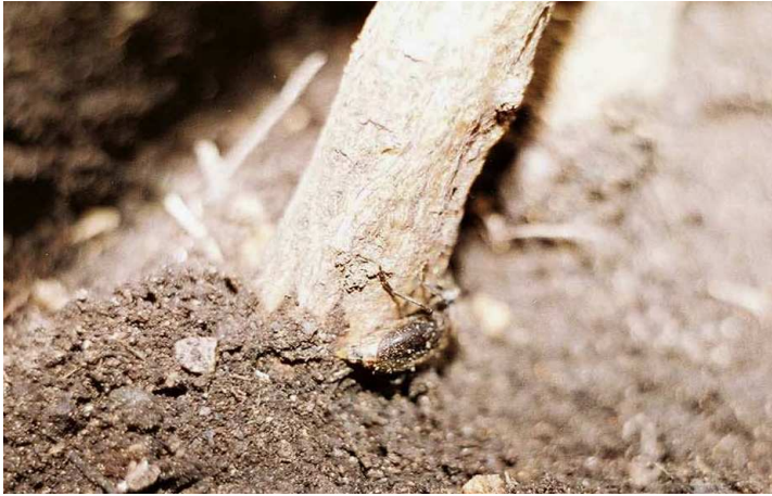
FIGURA 10. Hembra de Drymochares cylindraceus ovopositando en la parte inferior de un tallo.