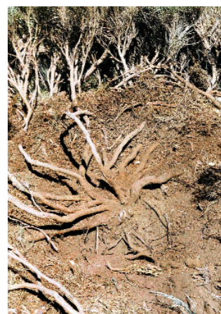
FIGURA 4. Tallos subterráneos totalmente despejados de detrito.