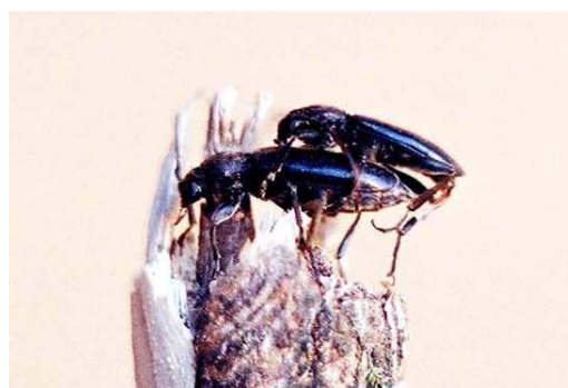
FIGURA 9. Cópula de Drymochares cylindraceus .

nal hundido. Las antenas son cortas y robustas y no sobrepasan el cuerpo; en las hembras apenas llegan a la mitad de éste. Sus cuatro primeros artejos están recubiertos por una pubescencia larga, dorada, tumada y desigual; los restantes artejos están recubiertos de un tomento muy fino (aspecto sedoso) excepto en los extremos, donde presentan algunas sedas que van desapareciendo progresivamente en sucesivos artejos hacia el extremo de la antena.