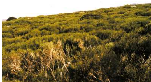
FIGURA 3. Arbustos de Cytisus con síntomas de haber sido atacados por Drymochoares cylindraceus .